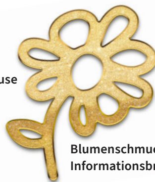
Blumenschmuckbewerb 2021: Informationsbroschüre

Diese Broschüre geht Ende März an jeden Haushalt unserer Gemeinde und informiert umfassend über den Ablauf der Aktion „Deutschfeistritz blüht auf 2021“. Sie enthält Details über geplante Veranstaltungen wie Kompost-Workshop und Pflanzlermarkt, gibt Tipps zum „Angarteln“ und erklärt alles Wichtige rund um den Deutschfeistritzer Blumenschmuckbewerb. Rund um das Frühlingserwachen dürfen allgemeine Gartentipps sowie Infos vom Obstbau- und Bienenzuchtverein auch nicht fehlen.