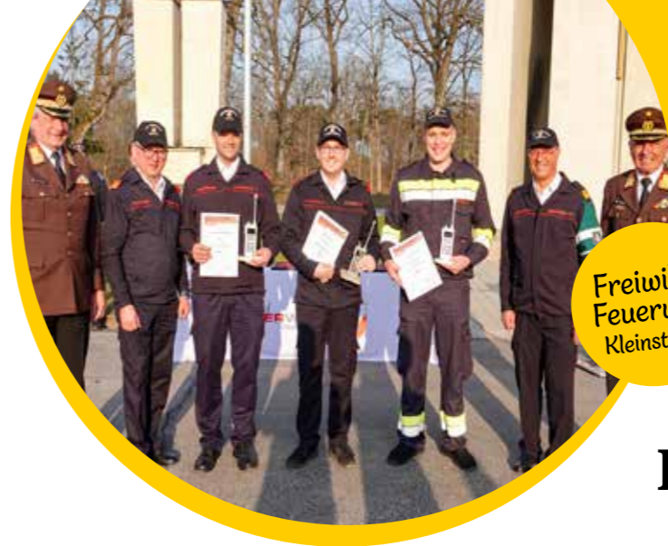
Freiwillige Feuerwehr Kleinstübing