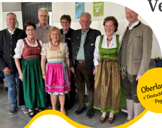
Oberlander z' Deutschfeistritz- Peggau